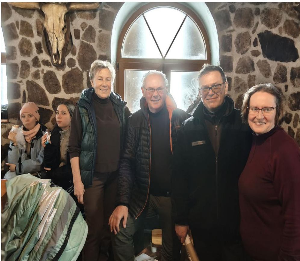
Gospodyni schroniska na Wysokim Kamieniu.

Pierwszego dnia biwaku mieliśmy przyjemność uczestniczyć w wernisażu wystawy zorganizowanej w Muzeum Carla i Gerharta Hauptmannów „Fotografia opowiada” podczas której wręczono nagrody autorom nagrodzonych prac.