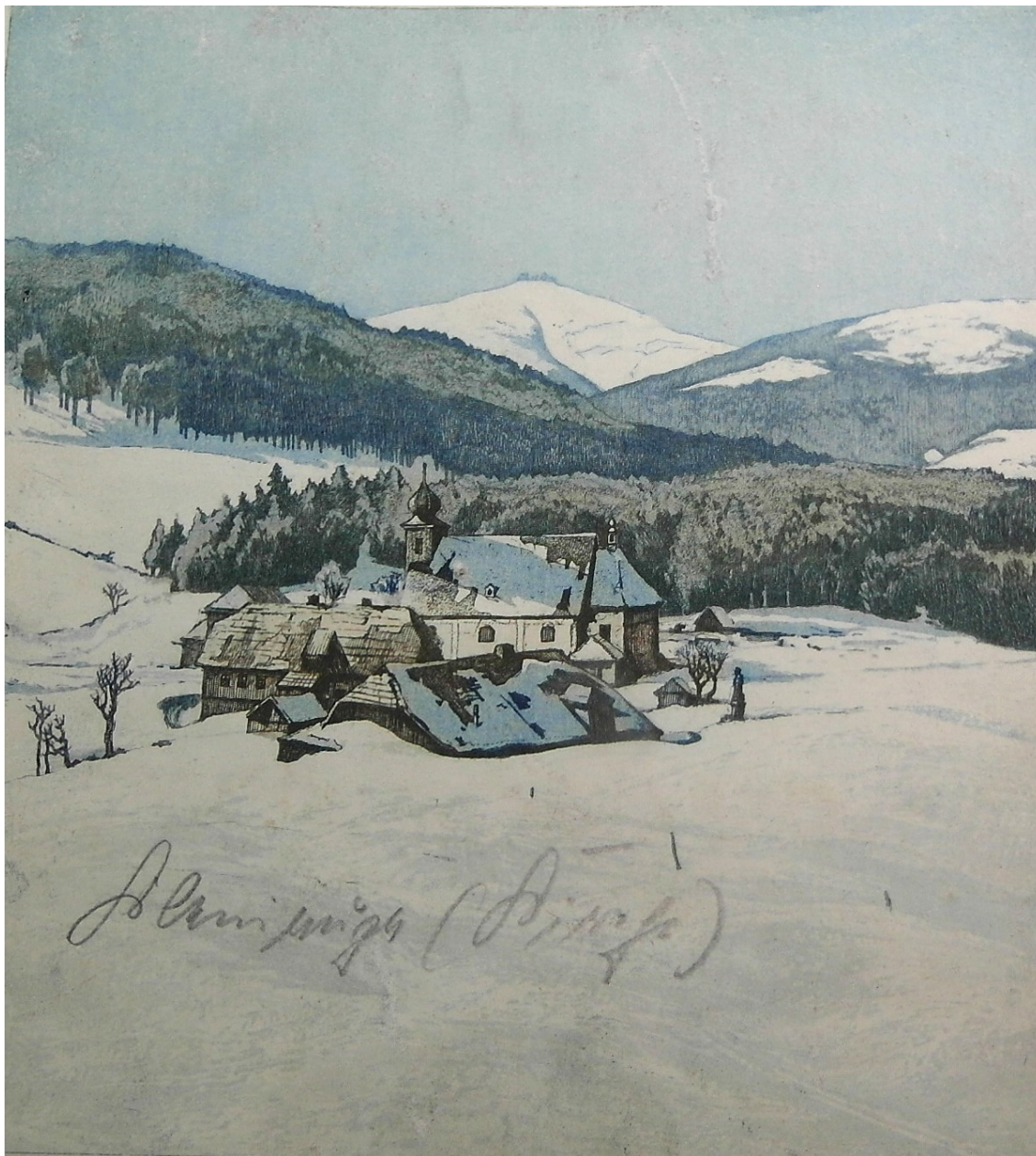
Fot. 13 Malá Úpa po czeskiej stronie ze Śnieżką w tle. I poł. XX wieku. Papier, akwaforta/akwatinta kol. Okładka matrycy

odwiedził wówczas Karpacz, Szklarską Porębę i Jelenią Górę. Dotarł do domu dziadka w Jeleniej Górze, gdzie spotkał się z wielką życzliwością ze strony obecnych właścicieli, którzy wiedzieli o poprzednim mieszkańcu tej willi.