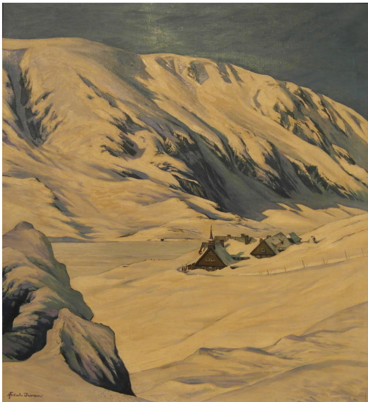
Fot. 6. Schronisko Samotnia nad Małym Stawem zimą. Płótno, olej

zimą. W jego twórczości dominują pejzaże zimowe z dominującą bielą śniegu i błękitem nieba (fot. 5). W 1914 roku został powołany do wojska i skierowany na front. Walczył na różnych frontach I wojny światowej. Przeżył i w 1918 roku wyjechał ponownie do Berlina. Tam poznał swoją przyszłą żonę Hedwig Weidler, z którą w 1921 roku wziął ślub. W 1922 roku młodzi małżonkowie zamieszkali w Karpaczu (fot. 6), a później w Jeleniej Górze.