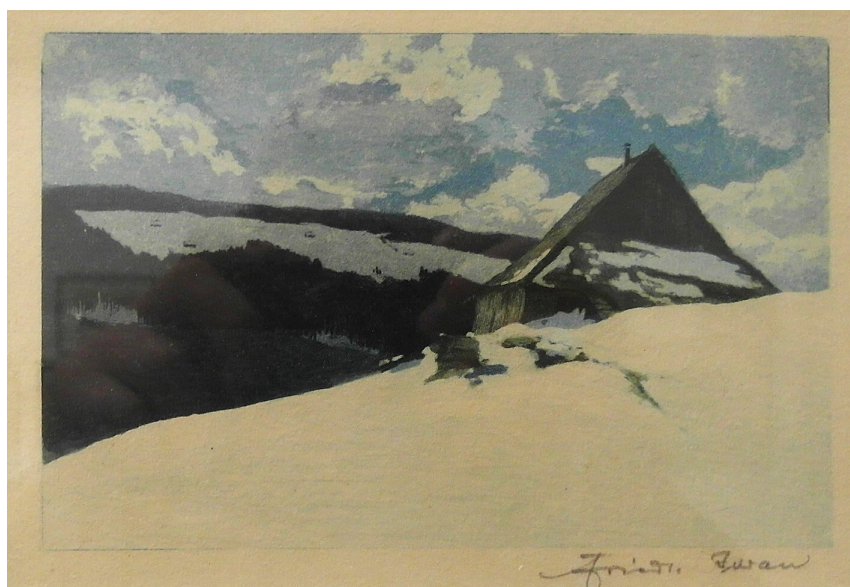
Fot. 5. Chata na grzbiecie górskim Kozi hřbety koło Pecy pod Śnieżką