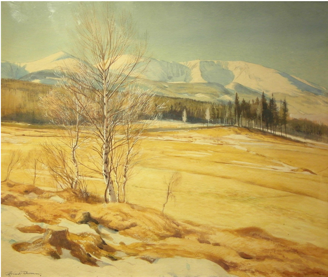
Fot. 7. Pejzaż z widokiem na zasypane śniegiem Śnieżne Kotły. Papier, akwarela

prace. Jego twórczość cieszyła się powodzeniem w całych Niemczech, a akwarele i obrazy olejne z najbardziej charakterystycznymi widokami gór znajdowały szybko nabywców (rys. 7).