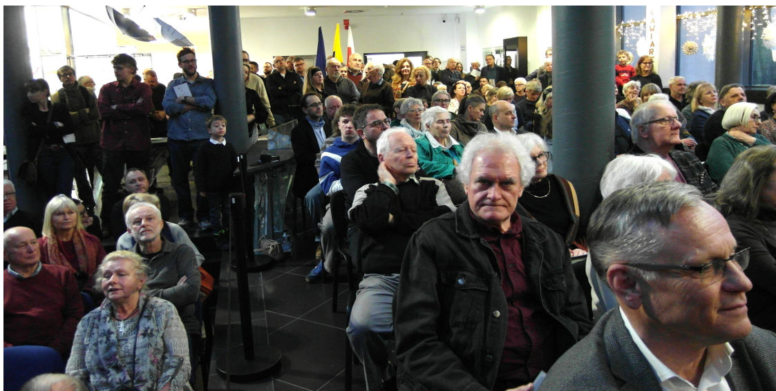
Fot. 9. Uczestnicy wernisażu

Może o tym świadczyć m.in. bardzo duży udział wielbicieli grafik i obrazów z pejzażami Karkonoszy podczas wernisażu wystawy (fot. 9). Już dawno otwarcie wystawy w Muzeum Karkonoskim nie cieszyło się taką popularnością.