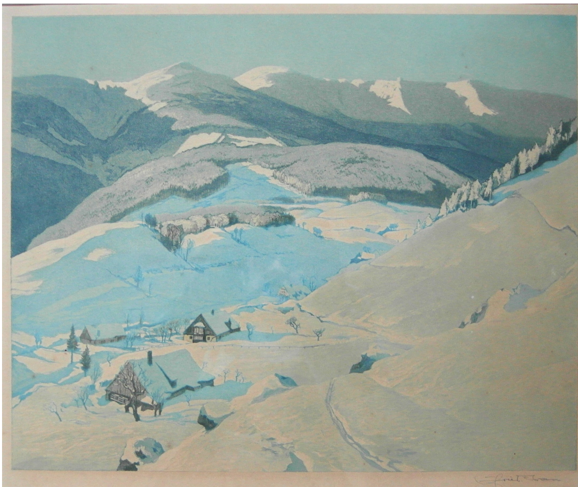
Fot. 4. Czarny Kociół Jagniątkowski zimą. Ok. 1933, akwaforta.