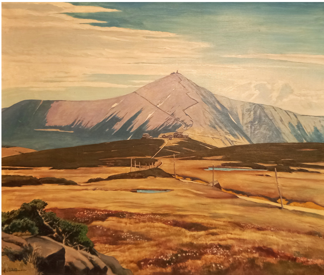
Fot. 11. Pejzaż ze Śnieżką. Płótno, olej (fot. J. Milewski)

Na skutek anonimowego donosu (prawdopodobnie spreparowanego) o posiadaniu radiostacji trafił na dwa miesiące do więzienia. Po wyjściu z więzienia wrócił do swego domu, ale zastał w nim już polskich lokatorów. W połowie 1946 roku musiał opuścić Jelenią Górę, gdzie zostawił cały swój dobytek wraz z ponad 350 płytami akwafortowymi. Po wojnie tylko część z nich trafiła do Muzeum Karkonoskiego (fot. 11). W Schlitz w Hesji odnalazł swoją rodzinę. W 1954 roku przeniósł się do Wangen, gdzie spotkał wielu dawnych towarzyszy z Karkonoszy.