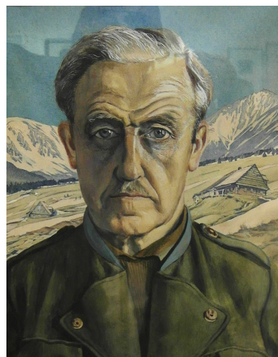
Fot. 12. Autoportret artysty. 1945, papier, akwarela