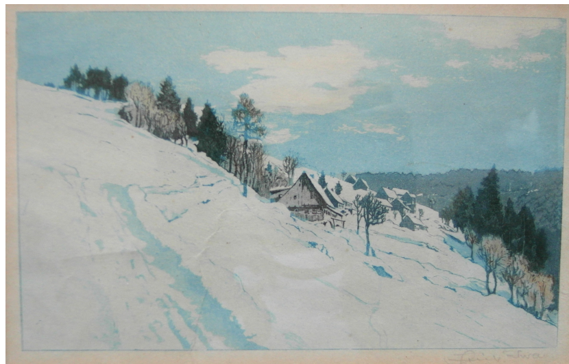
Fot. 8. Wieś w Górach Sowich. Akwaforta, akwatinta (fot. J. Milewski - zbiory prywatne)

Jego grafiki i obrazy były szeroko dostępne, stąd ich popularność z przeznaczeniem na różnego rodzaju prezenty. Dzieła F. Iwana zdobią pewnie obecnie niejedno mieszkanie współczesnych mieszkańców Jeleniej Góry i Kotliny Jeleniogórskiej (fot. 8).