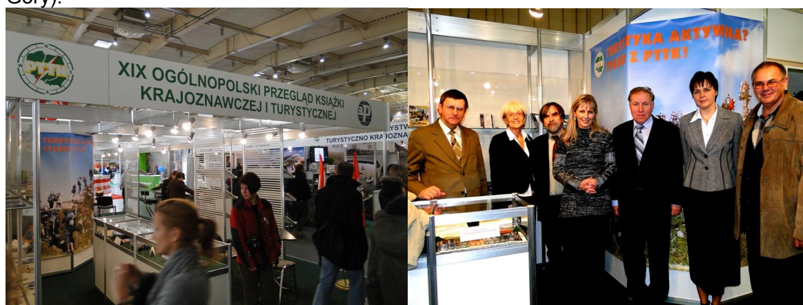
Stoisko Przeglądu na Tour Salonie