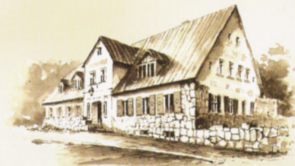
Muzeum Ziemi „JUNA” w Karczmie Głodowej z XVIIw.

Dziś w Szklarskiej Porębie czynne są dwa specjalistyczne muzea: Muzeum Mineralogiczne (Marysin, ul. J.Kilińskiego 20) i Muzeum Ziemi (Szklarska Poręba Średnia, Szosa Jeleniogórska 9). Aktywnie działa Sudeckie Bractwo Walońskie , kultywując dawne tradycje i obrzędy.