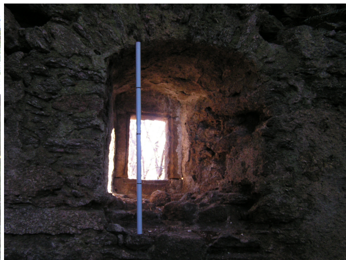
12. Ubytki oprawy okiennej (tyczka 1 m)