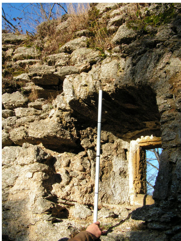
7. Ubytki obróbki okiennej, braki attyki (tyczka - 1 m)