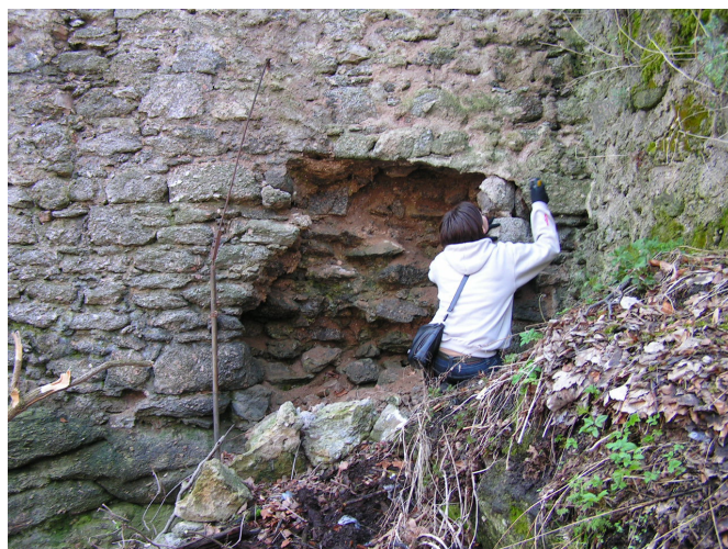
2. Ubytek muru