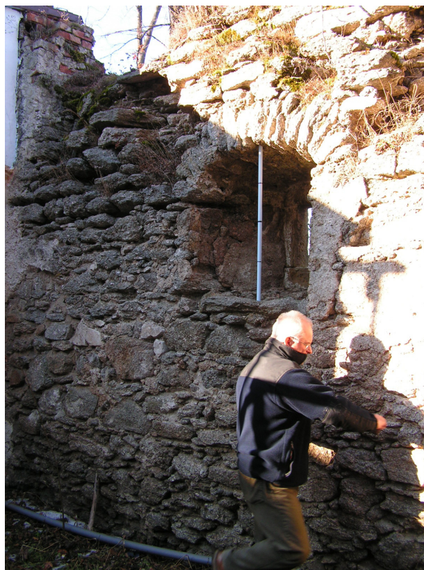
6. Ubytki korony muru i braki attyk, głęboko wypłukane spoiny - od strony wewnętrznej