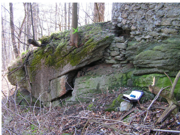
3. Oddzielenie głazu od podłoża, ubytek muru (samosiejka do usunięcia)