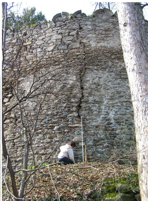
4. Szczelina na wysokości całego muru (tyczka - 2 m), brak attyk na koronie