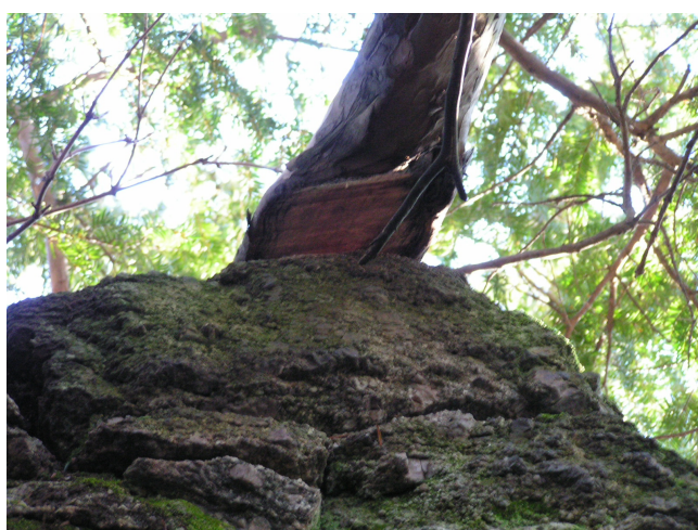
14. Ocieranie gałęzi cisa o koronę muru brak attyk