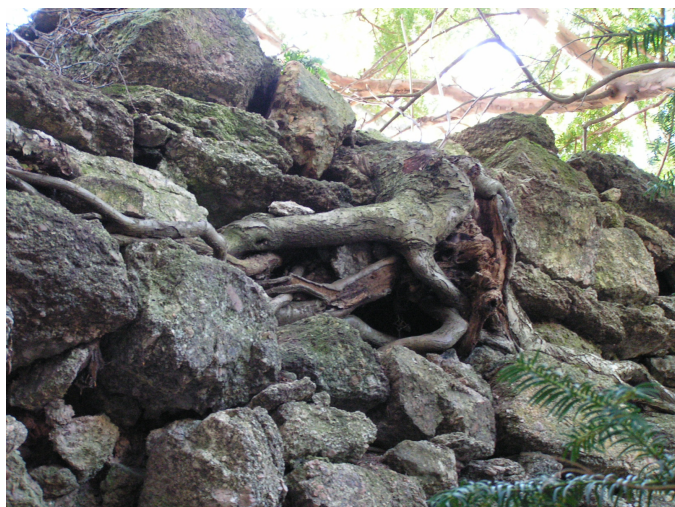
13. Korzenie samosiejek na koronie muru brak attyk,