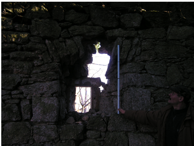
10. Ubytki oprawy otworu okiennego (tyczka -1 m)