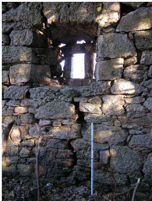
9. Ubytki oprawy otworu okiennego, szczelina (tyczka -1 m)