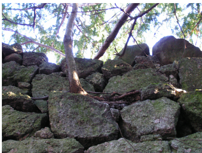
11. Samosiejki na koronie muru, brak attyk