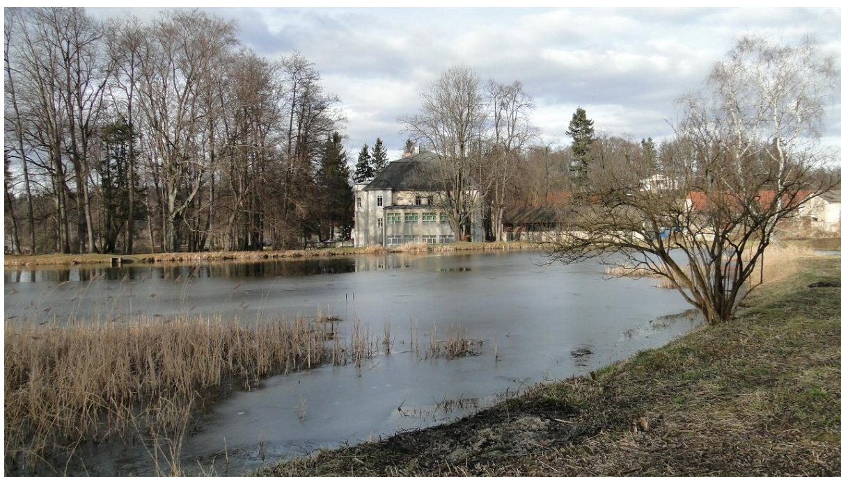
Pałac w Bukowcu widziany z grobli, na której stała Ławeczka.

Bukowiec to mała miejscowość nieopodal Kowar. Zatopiona w zieleni i otoczona stawami. Mimo, iż od głównej drogi prowadzącej z Jeleniej Góry do Kowar dzieli ją tak niewiele to czas płynie tu nieco wolniej. Nikomu nigdzie się nie spieszy. Jest tutaj jednak coś co wyróżnia tą miejscowość od innych. Każdy pomyśli, że są to przepiękne widoki na Karkonosze. Oczywiście. Ale nie tylko. Widoki podobne rozpościerają się także z sąsiednich wiosek. Ci, którzy osiedlają się tu w dniu dzisiejszym cenią sobie bliskość do głównych ośrodków naszego regionu, piękno tego miejsca ale przede wszystkim to coś. Coś czego, tak na dobrą sprawę nie da się opisać. Coś czego przy dłuższych wyjazdach brakuje. Czegoś co powoduje, iż chce się wracać do domu, i to jak najszybciej.