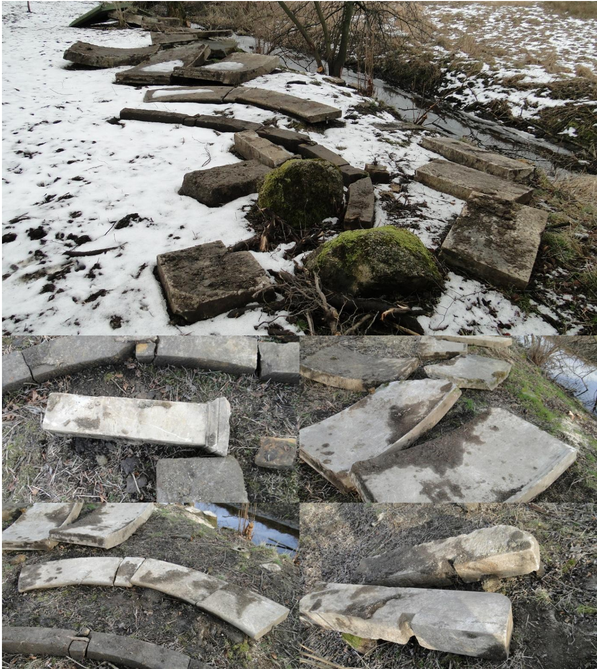
Odnalezione elementy ławeczki.

Ponieważ nikomu ni była ona wówczas potrzebna szybko zapomniano o niej i gdy nastały nowe lepsze czasy dla znajdujących się tu obiektów nikt już nie pamiętał o niej. Ustawiono zatem w miejscu gdzie powinna się ona znajdować tablicę informacyjną, na której napisano: „Miejsce ustawienia i wygląd klasycystycznej marmurowej ławki, ..., można ustalić na podstawie XIX-wiecznych litografii, gdyż do dziś nie zachował się żaden z jej elementów”.