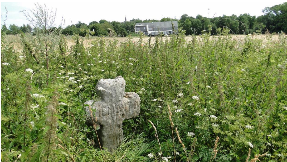
Browar w Miedziance.

My oczywiście, mimo iż nie przesadziliśmy z trunkiem, dotarliśmy do owego zabytku dawnego prawa karnego i po zastanowieniu się nad naszymi dzisiejszymi przeżyciami udaliśmy się do Janowic Wielkich, gdzie wsiedliśmy do pociągu zmierzającego do Jeleniej Góry.