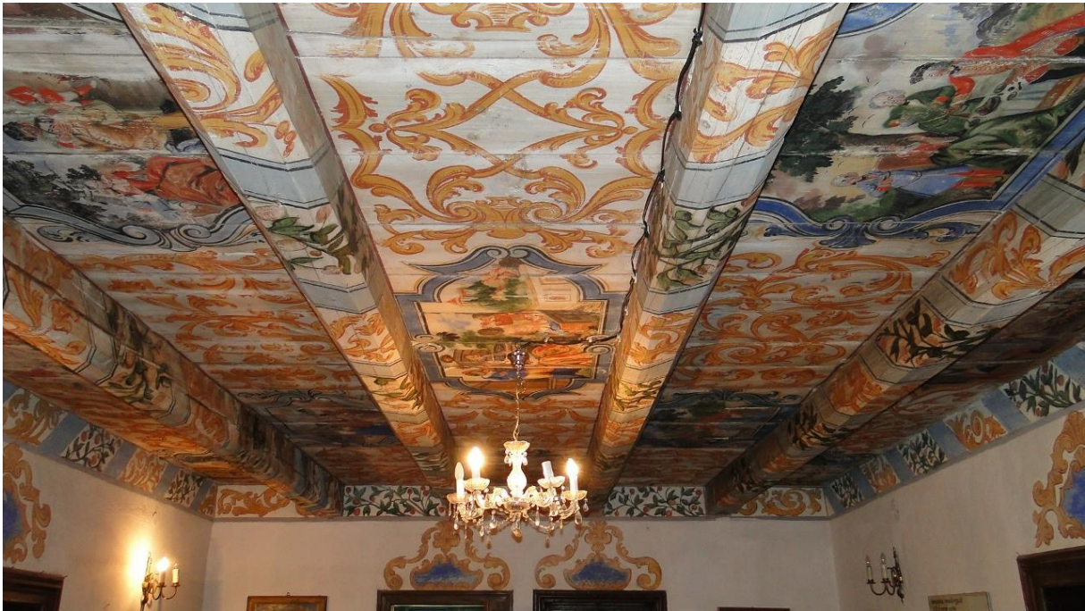
Ozdobny strop dworu w Mniszkowie.

ptaków. Sama zaś ścieżka, przysypana igliwem, wydaje się być jak dywan. Rzadko zdarza się takie połączenie. Nic więc dziwnego, że jeszcze bardziej zwolniliśmy kroku.