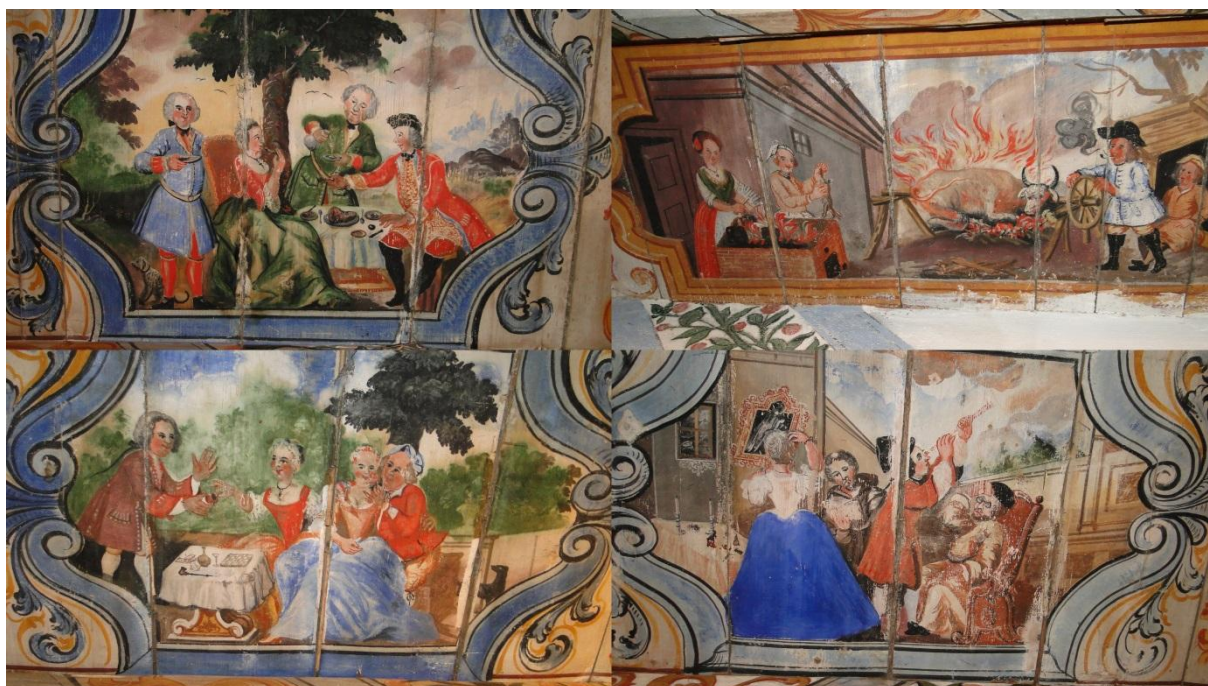
Ozdoby malarskie na stropie dworu w Mniszkowie.