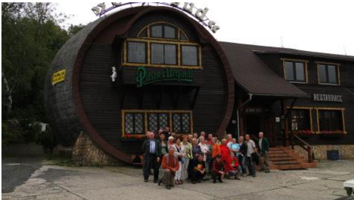
Wielka beczka.

dotarcie do tego miejsca. Cała dzisiejsza wycieczka jest bardzo trudna i wymagająca. Myślę oczywiście o trasie, nie o uczestnikach. Gdy nasyciliśmy swoje oczy tymi wspaniałymi widokami ruszamy na dół. Najpierw schodząc bardzo ostrożnie ze skał, później stromą ścieżką w dół staramy się nie rozpędzać tak by nie połamać sobie nóg. Wkrótce docieramy do Hejnic gdzie spotykamy pozostałe osoby. Wszyscy robimy drobne zakupy i ruszamy w drogę powrotną do domu. Ale najpierw zajżdżamy do postawionej w 1931 roku wielkiej, bo mieszczącej około miliona litrów beczki przerobionej na restaurację. Jesteśmy w Wielkiej Beczce (Obři sud). Ponieważ czujemy lekki głodek a nie ma w pobliżu Danonka chcemy zamówić coś konkretnego. Niestety pani kelnerka zamiast przyjąć zamówienie woła, że jest nas za dużo, że nie ma czasu i odchodzi. Jesteśmy delikatnie mówiąc rozczarowani. Dziwna sytuacja. Chyba przeszkodziliśmy pani w jakiś planach. Może chciała wcześniej pójść do domu. Gdy po pewnym czasie wracam na salę widzę, że pani jednak przyjmuje zamówienia. Nie wiem co zmieniło jej nastawienie. Może rozmowa z szefem. Składam zamówienie i po chwili wszyscy jemy smaczne kotleciki. Nie powiem obiad był bardzo smaczny. I gdyby nie pierwsze wrażenie byłoby całkiem przyjemnie. Niestety nie wszyscy posłuchali rady by nie dawać żadnych napiwków. Uważam że tym razem danie napiwku jest niewychowawcze. Trudno.