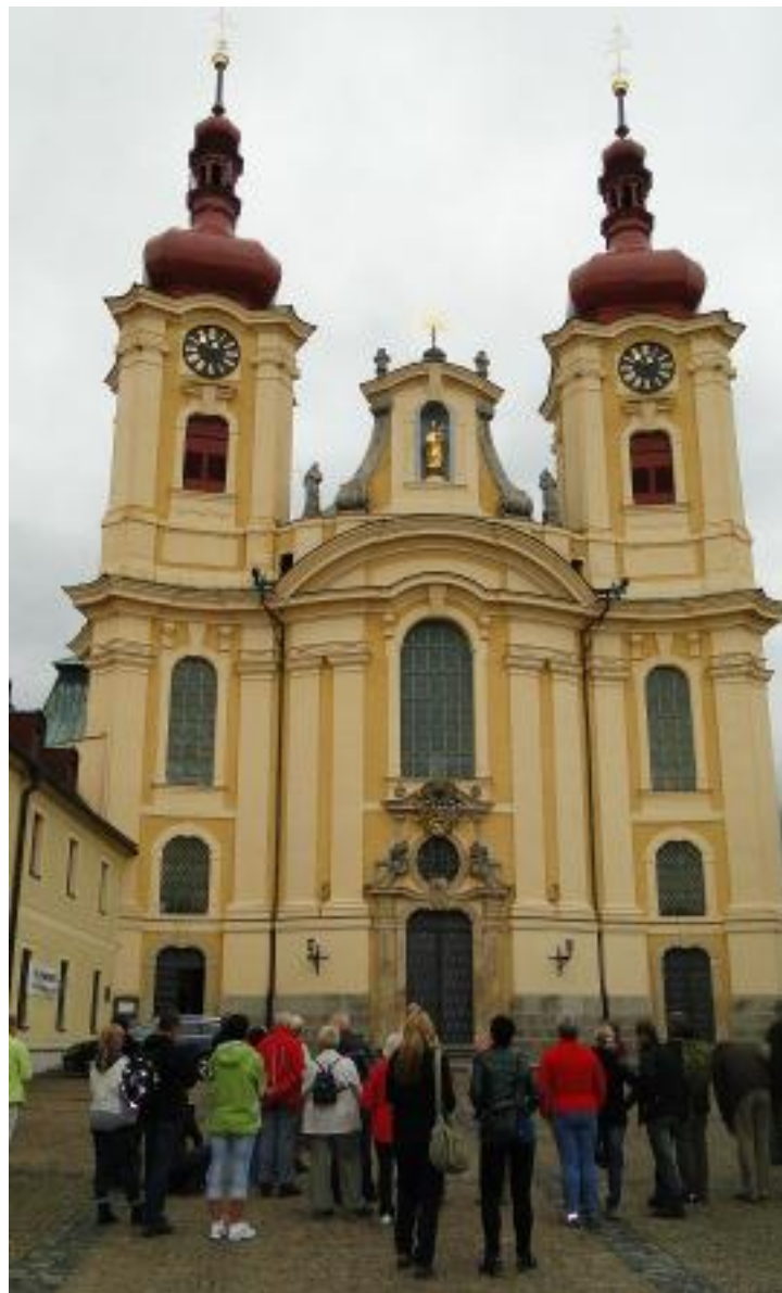
Kościół Nawiedzenia Najświętszej Panny Marii.

Ponieważ był to już koniec naszego spaceru po zamku prowadzący nas pan Marcin zaprosił nas do ponownego odwiedzenia tego miejsca sugerując zwiedzanie wieczorne. Ja dodam tylko, iż podczas naszej wędrówki skrzętnie liczyłem wszystkie schody jakie musieliśmy pokonać idąc zarówno do góry jak i na dół i wyszło mi ich aż 252. A nie są to oczywiście wszystkie jakie tu się znajdują. Jest ich kilkakrotnie więcej.