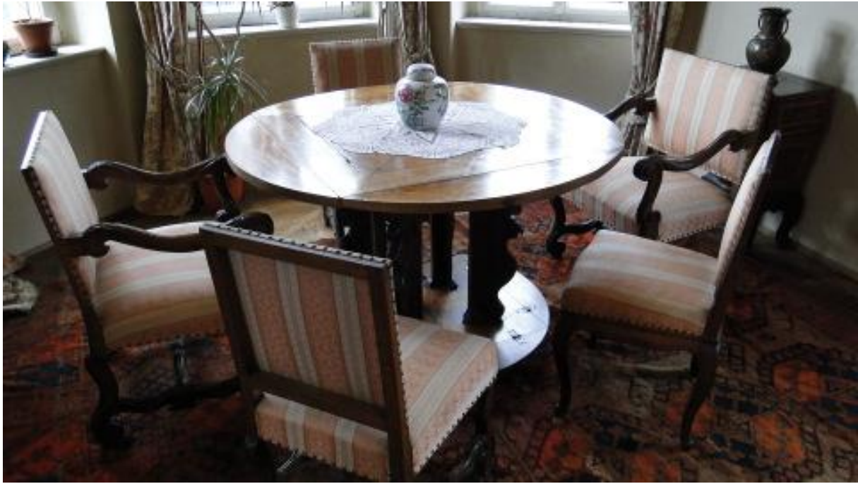
Barokowy okrągły stół z możliwością przerobienia go na kwadrat.

najkrótszą drogą prowadzącą do łóżka. Niestety zarezerwowane to było tylko dla osoby korzystającej z przyległej sypialni. Pozostali goście musieli korzystać z korytarzy. W pomieszczeniu obok znajduje się barokowy stół, który swoim kształtem wzbudza szczególne zainteresowanie. Normalnie jest on okrągły. I to zarówno blat jak i część podnóżkowa. Jednak widoczne zawiasy pozwalają obie części złożyć by z kręgu zrobić kwadrat. Wiadomo przecież, że przy okrągłym stole się nie kantuje. Tak samo panie mogły spokojnie korzystać z tego mebla bez ryzyka pozostania starymi pannami.