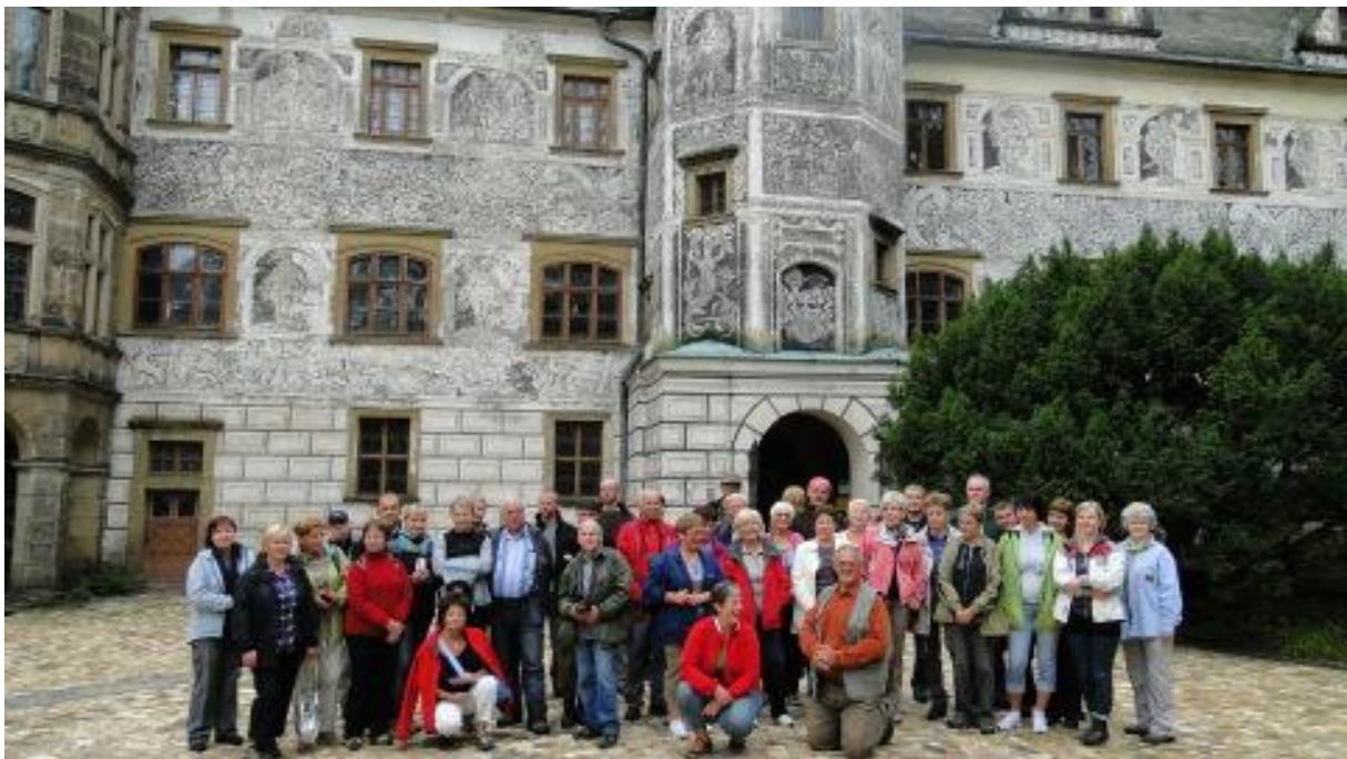
Uczestnicy wycieczki na dziedzińcu zamkowym.

Docieramy na piętro męskie. Nareszcie widzimy wspaniale zdobione i kolorowe sufity. Wszak wiadomo nie od dzisiaj, że to mężczyźni są bardziej wrażliwi na piękno. Przynajmniej tak było dawniej. Pokój sypialny wyposażony jest w boczne przejście dla służby. Jest tu wszystko czego trzeba by przenocować i odpocząć. Nawet biblioteka. I to jest to! A gdy już się nie śpi to można udać się do