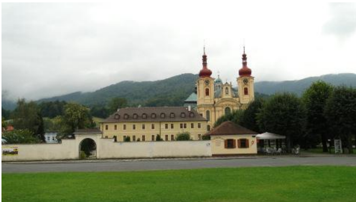
Sanktuarium w Hejnicach.

Gdy tak czekaliśmy by ruszyć w dalszą trasę z niepokojem patrzyliśmy na spowite w mgłach góry. To przecież tam mamy za chwilę się wspinać. Na szczytowej skałce widać krzyż. Mamy nadzieję, że chmury zostaną rozwiane i nie zaczną padać. Byłoby nieciekawie. Ruszamy zatem do cukierenki. Może coś smacznego poprawi nam humory. Po chwili zastanowienia wybieramy jednak lody. Okazało