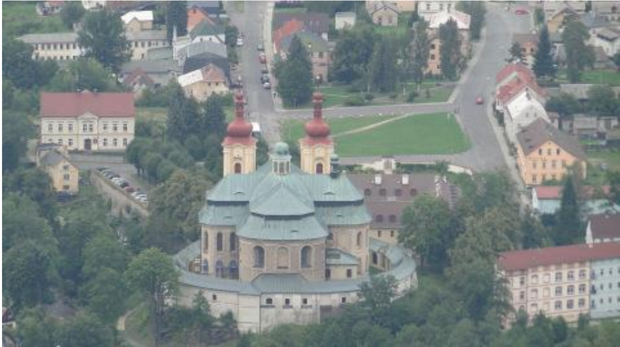
Widok na Hejnice z Ořešnika.