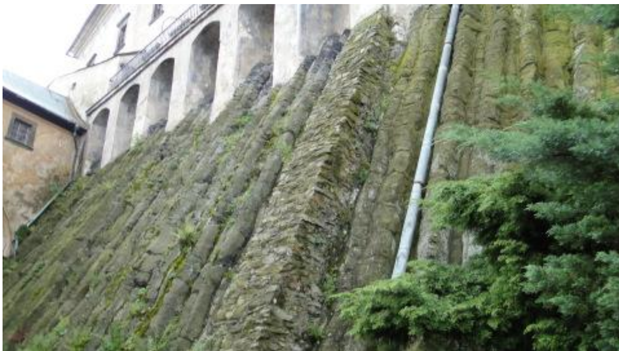
Bazaltowe skały, na których wsparto mury zamku we Frydlancie.

Zaraz po dotarciu do Frydlantu podeszliśmy do kasy zamkowej aby odebrać zamówione na godzinę dziesiątą bilety. Już tam zamek wydawał nam się być dużym obiektem. Jednak dopiero po zwiedzeniu poznaliśmy jego ogrom. Główną atrakcją zamku są zgromadzone tu oryginalne eksponaty. Zamek bowiem nigdy nie był opuszczony. Do końca II wojny światowej był własnością prywatną, a potem przejęło go państwo, które już w 1947 roku ponownie otworzyło w nim muzeum, funkcjonujące tu już od 1801 roku. Jest to najstarsze tego typu muzeum w środkowej Europie. Aby tu wejść trzeba jednak zapłacić aż 210 koron. Bilety ulgowe przysługują tylko młodzieży i studentom. Czesi niestety nie stosują zniżek dla emerytów. Dowiedzieliśmy się, iż zarówno w dniu dzisiejszym jak i jutro, w godzinach wieczornych ma odbywać się tu coś w rodzaju naszych nocy muzealnych. Z tą tylko różnicą, że u nas wstęp jest bezpłatny a tu nie. Uczestniczący w nocnym zwiedzaniu zostaną jednak poczęstowani ciastami.