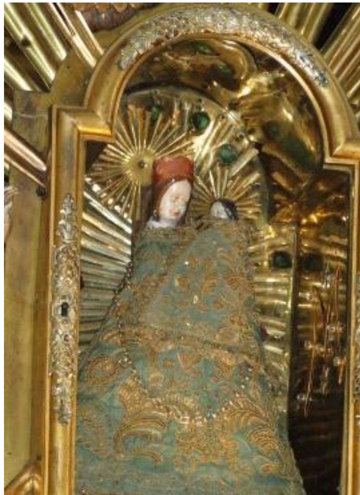
Cudowna figurka Matki Bożej Wspaniałej.